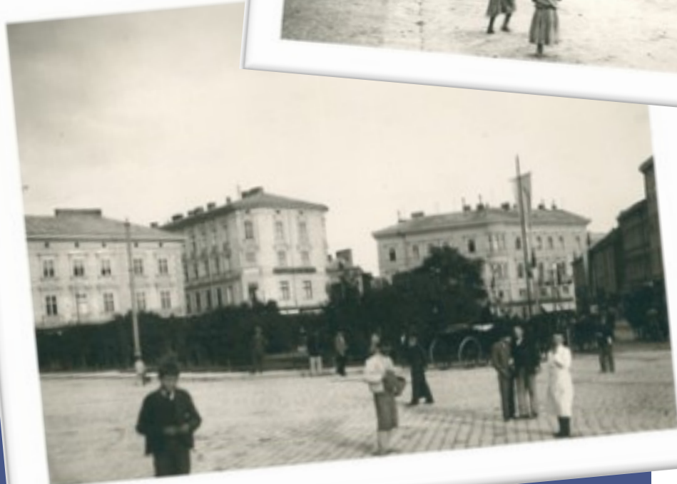
Lwów - Dworzec Główny, ulica Teatralna, Plac Mariacki

W 1910 r. Lwów był domem dla 206 000 osób, z czego 85% jako język ojczysty, podało język polski. Na język ukraiński wskazało 10% mieszkańców. Zdecydowaną większość społeczności stanowili Polacy, jednak miasto w swoich przyszłych granicach widzieli także Ukraińcy.