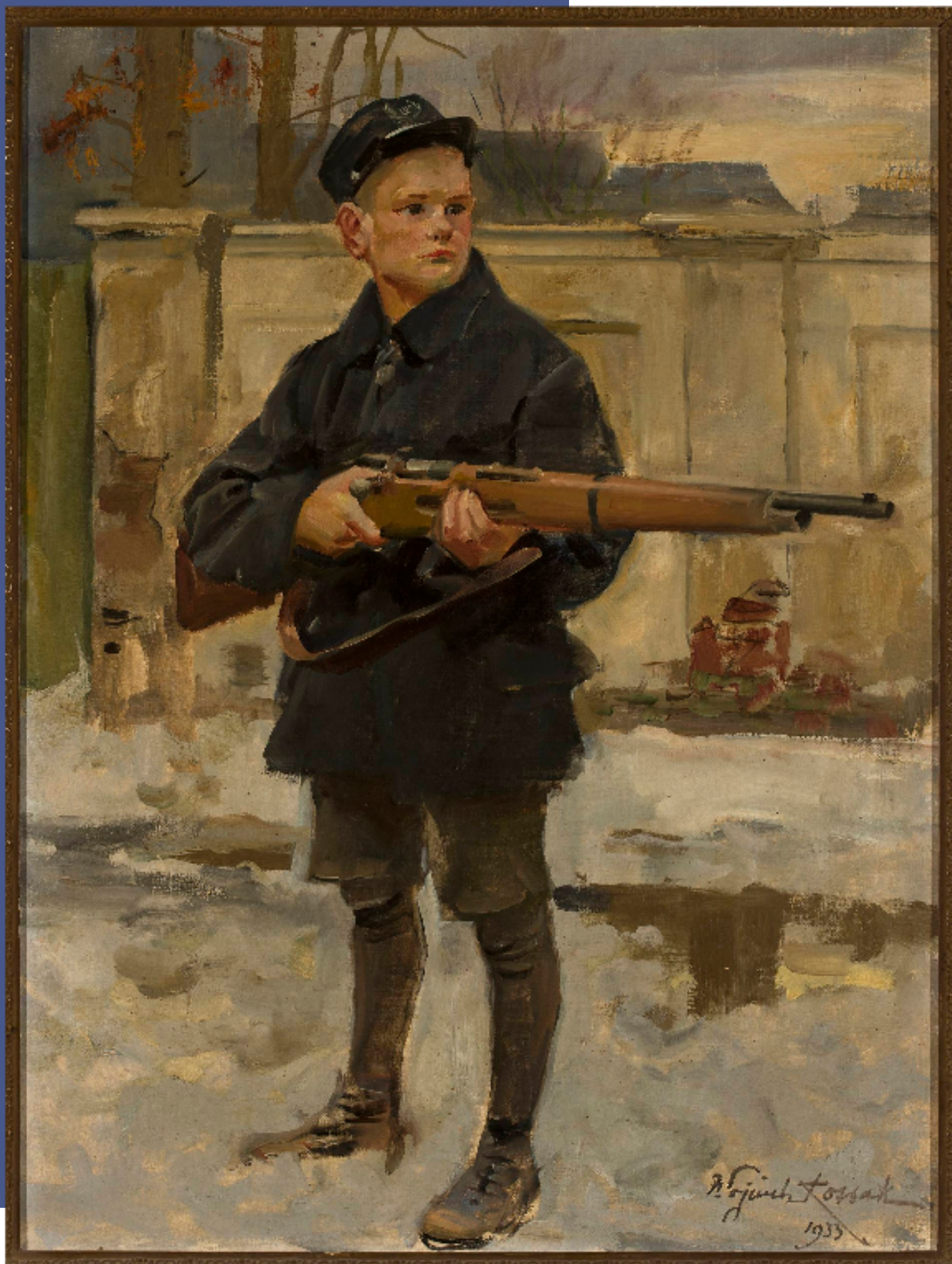
"Orlą lwowskie", Wojciech Kossak

W walkach o miasto udział wzięli także uczniowie i studenci. Młodych obrońców Lwowa określa się mianem Orląt Lwowskich.