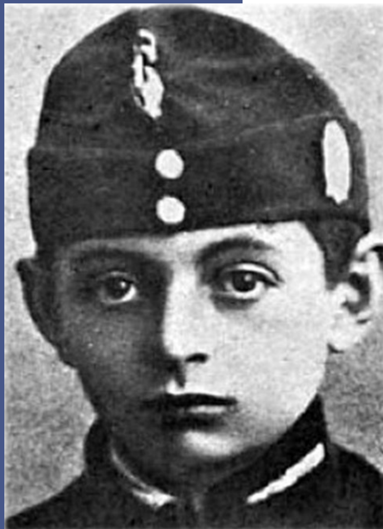
Antonii Petrykiewicz