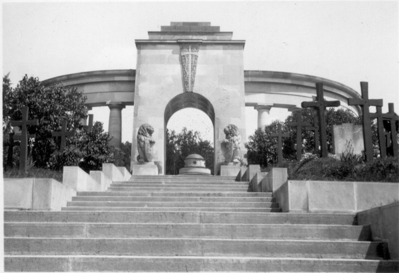
Pomnik na Cmentarzu Obrońców Lwowa, 1938 r.

Bohaterstwo obrońców Lwowa przeszło do legendy. Mieszkańcy miasta uważali, że uczestnicy walk powinni spocząć razem i należy im się wyjątkowy pomnik.