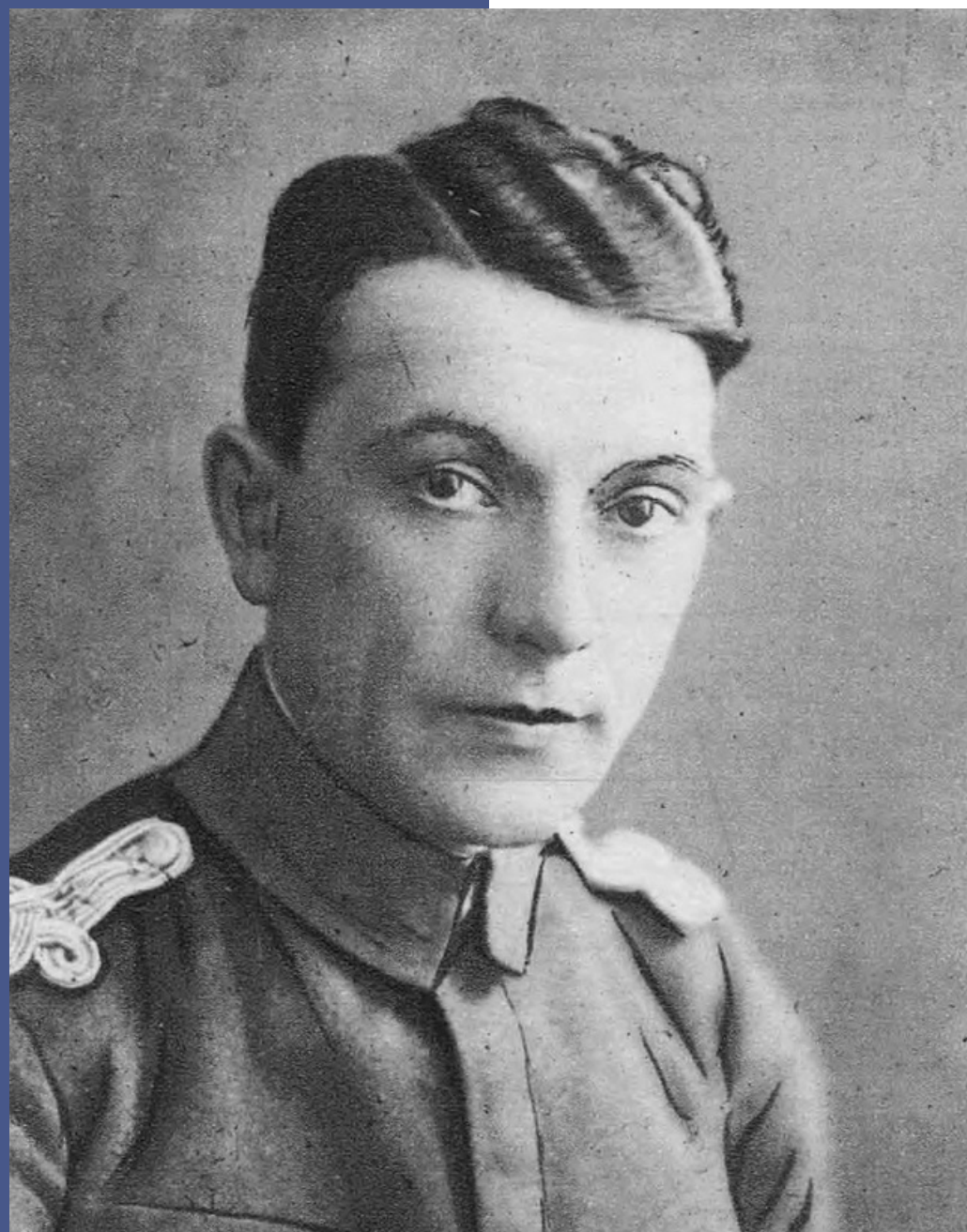
Rudolf Indruch

Bohaterstwo obrońców Lwowa przeszło do legendy. Mieszkańcy miasta uważali, że uczestnicy walk powinni spocząć razem i należy im się wyjątkowy pomnik.