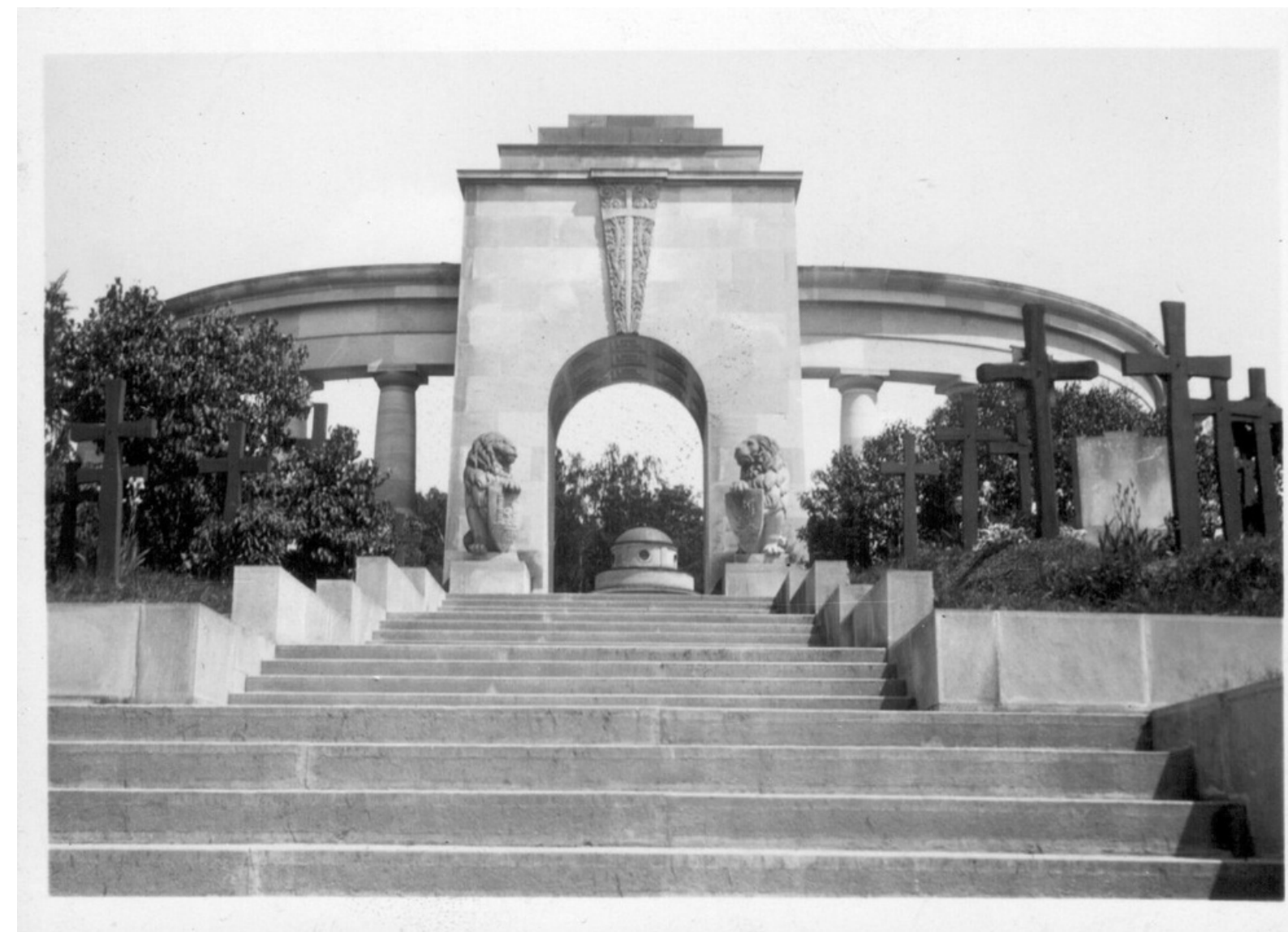
Pomnik na Cmentarzu Obrońców Lwowa, 1938 r.